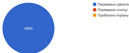
Рис.2 – Кількість варіантів відповідей на питання: «На Вашій спеціалізації навчаються переважно дівчата чи хлопці?»

На Вашій спеціалізації навчаються переважно дівчата чи хлопці? 13&nbsp;респондентів