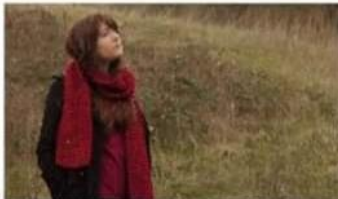
MID SHOT MS