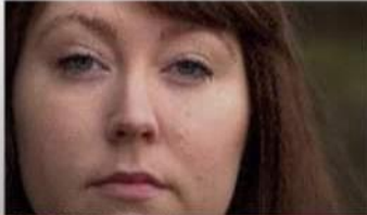
BIG CLOSEUP BCU