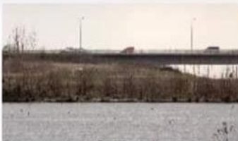
EXTREME LONG SHOT XLS