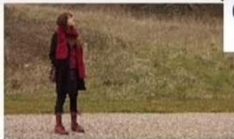
LONG SHOT LS