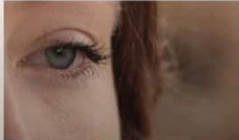
EXTREME CLOSEUP ECU