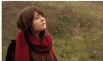
MEDIUM CLOSEUP MCU