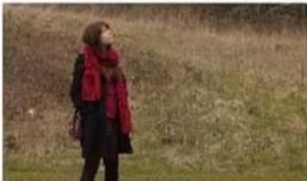
MEDIUM LONG SHOT MLS