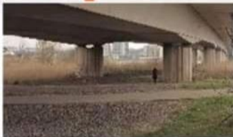
VERY LONG SHOT VLS