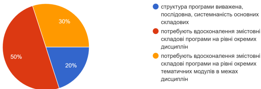
Рис. 1. – Кількість варіантів відповідей на питання: «Оцініть загальну структуру навчальної програми (відкритість та зрозумілість концепції, послідовність вивчення дисциплін)»

3. Оцініть загальну структуру навчальної програми (відкритість та зрозумілість концепції, послідовність вивчення дисциплін) 10&nbsp;ответов