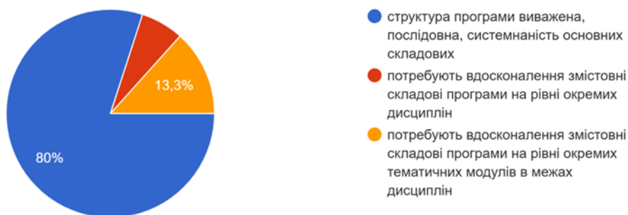
Рис. 1. – Відповіді на питання «Оцініть загальну структуру навчальної програми (відкритість та зрозумілість концепції, послідовність вивчення дисциплін)»

3. Оцініть загальну структуру навчальної програми (відкритість та зрозумілість концепції, послідовність вивчення дисциплін) 15&nbsp;ответов