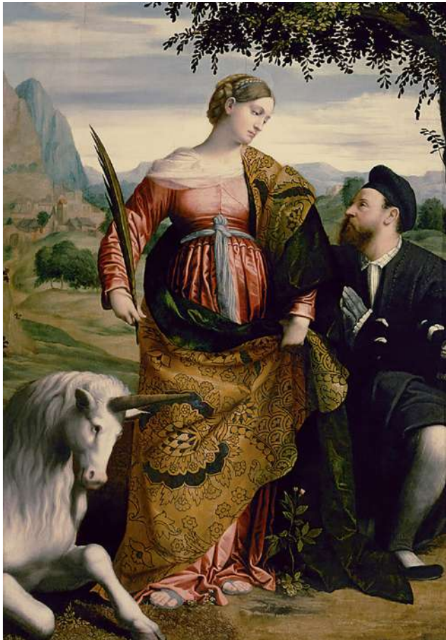
Іл. 7. Моретто да Брешиа. Свята Юстина з єдинорогом . Бл. 1530–1534. Панно. О. 200 × 139 см. Музей історії мистецтва, Відень

закликає владу країн не лише виражати «хвилювання» з приводу проблем екології, а й почати діяти. Усе почалося 2018 р., коли 15-річна Грета Тунберг одна вийшла до парламенту Швеції з саморобним плакатом і заявою, що вона не піде до школи, доки держава не зверне увагу на лісові пожежі й не почне виконувати Паризьку угоду про клімат. За один рік екозахисниця взяла участь у зустрічі з Європейським Парламентом у Страсбурзі, у засіданні Ради ООН, стала жінкою року в Швейцарії та людиною року за версією всесвітньовідомого американського журналу «Time» [6].