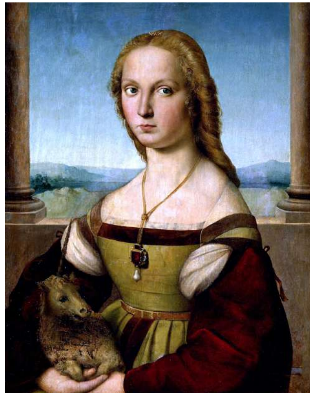
Лл. 6. Рафаель Санті. Жінка з єдиногомом. Бл. 1506. Д., о. 65 × 61 см. Галерея Боргезе, Рим

Але останнім часом спостерігається інша тенденція. Є очевидним, що у виданні окрім великої кількості реклами та модних новин представлено певну інформацію розважального, виховного та просвітницького характеру. Особливістю глянцевого журналу сьогодення стає те, що відбувається переміщення уваги на такі серйозні питання, як насильство в родині, екологічні проблеми та війни в різних регіонах планети. Аналізуючи теоретичні підходи до естетичного в дизайні з точки зору загальної теорії естетики, професорка О. Лагода доводить, що історичні, соціокультурні та економічні трансформації в розвитку суспільства, а також художній досвід людства зумовили зміни у формуванні естетичних цінностей, зокрема дизайн-продуктів, таких як гляцевий журнал [2]. У статтях гляцевих журналів усе частіше лунають заклики до благодійності, розглядаються психологічні аспекти стосунків між людьми, що впливає на вибір редакцією головного героя номеру.