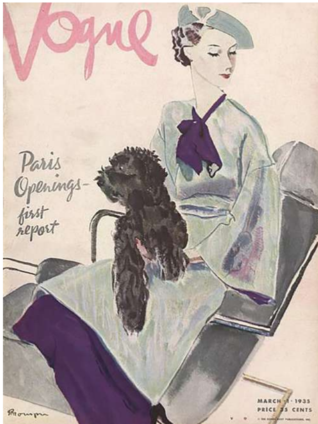
Іл. 3. «Vogue». Березень, 1935. URL: https://archive.vogue.com/issue/19350301

модний журнал «Mercure galant», але виходив він нерегулярно (іл. 1). Це видання можна назвати прототипом нинішнього глянцу. Відділяючи шапку журналу від другорядної інформації завдяки розміру шрифту та за допомогою гарнітури, творці урівноважували композицію, заповнюючи весь простір обкладинки.