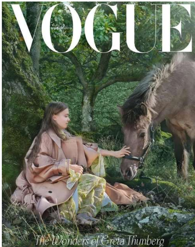
Лл. 5. «Vogue». Серпень, 2021. URL: https://www.voguescandinavia.com/e-magazine

потреби людей заповнити вільний час, тому тематика контенту здебільшого уникає серйозних тем, основне її призначення – надавати емоціональну розрядку читачам. Головні сюжети зазвичай зосереджені на догляді за собою, подорожах, моді, кар’єрі та формуванні певного способу життя, так званого life style. Взагалі глянець можна охарактеризувати як продукт індустрії дозвілля, тому найчастіше героями випуску стають відомі персони зі світу кіно, шоубізнесу, моди тощо.