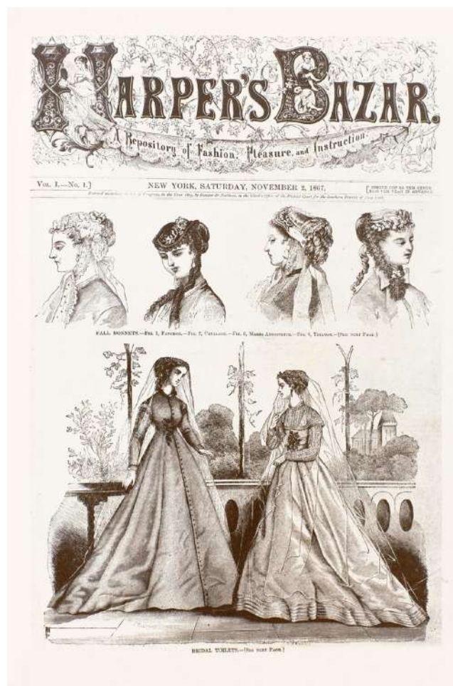
Лл. 2. «Harper's Bazar». Листопад, 1867. URL: https://www.harpersbazaar.com/culture/features/a18658/history-of-harpers-bazaar/

Другою ознакою є візуальне наповнення журналу. Ілюстрації високої якості сповнені художніх образів, що здійснюють комунікацію з читачами і таким чином здійснюють свій вплив на них. Багато ознак свідчать про універсальність і системність візуальної мови дизайну періодичних ви-