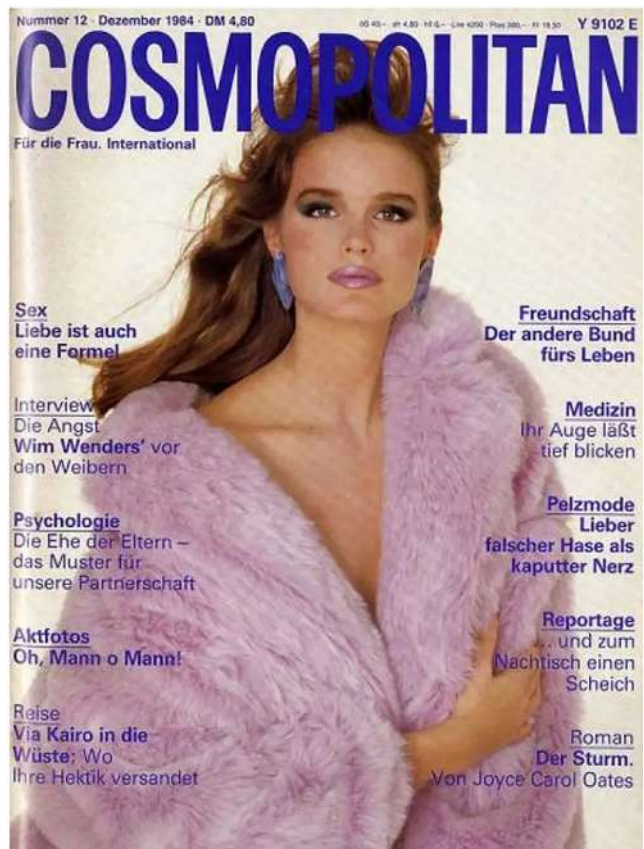
Іл. 4. «Cosmopolitan». Грудень, 1984. URL: https://www.cosmopolitan.de/die-cover-der-cosmopolitan-1980-1985-9633.html

З кінця XX ст. на обкладинках журналів усе частіше з'являються фотографії моделей, актрис і зірок шоубізнесу, які транслиують на аудиторію об-