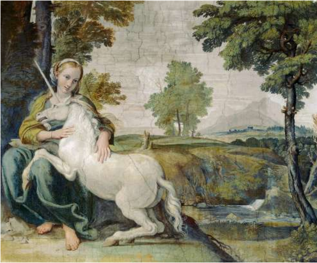
Іл. 9. Доменіко Замп'єрі. Богоматір з єдинорогом. 1604–1605. Фреска. Палаццо Фарнезе, Рим

(іл. 6), Моретто да Бреція «Свята Юстина з єдинорогом» (бл. 1530–1534) (іл. 7) тощо унаочнювали цю легенду й затверджували у свідомості людей та суспільстві християнський ідеал жіночої чесноти. Ще яскравіше цей образ був вирішений у творі Луки Лонгі «Леді та Єдиноріг» (бл. 1535–1540) (іл. 8), а також у Доменіко Замп'єрі «Богоматір з єдинорогом» (1604–1605) (іл. 9). Останні два твори поєднують спільна іконографія, зокрема виражена в ракурсі єдинорога. Як вважають історики, в обох випадках мистці зобразили Джулію Фарнезе (1474–1524), італійську дворянку, яка була коханкою Римського Папи Олександра VI (до інтронізації – Родріго Борджія) і сестрою Папи Павла III. Свого часу вона була відома як Giulia la bella («прекрасна Джулія»), належала до аристократичної родини Фарнезе, але увійшла в історію як символ любові, нев'янучої жіночої краси та чарівності. Хоча єдиноріг був емблемою її родини, образ Фарнезе поряд з цією твариною уособлював вічну красу, цнотливість і гармонію божественної природи.