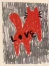
BERDUCH KAROLINA / POLAND БЕРДУЧ КАРОЛІНА / ПОЛЬЩА