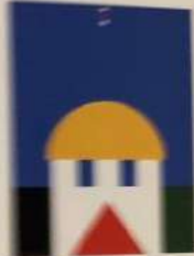
ITALY / ITALY ITALY / ITALY