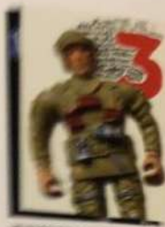
AFGHANISTAN / U.S.A. AFGHANISTAN / U.S.A.