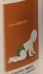
MEXICO / MEXICO MEXICO / MEXICO