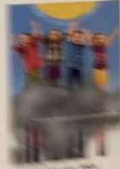
ITALY / ITALY ITALY / ITALY