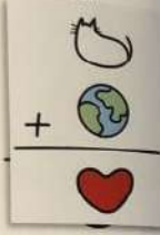
YANG JE-FEI / TAIWAN ЯНЬ ЦЕ-ФЕЙ / ТАЙВАНЬ