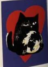
VOLPE NATALIA / ARGENTINA ВОЛПЕ НАТАЛІЯ / АРГЕНТИНА