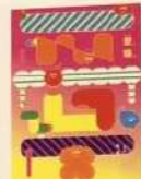
LIU WEIWEI / CHINA ЛІУ ВЕЙВЕЙ / КИТАЙ