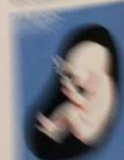
MEXICO / MEXICO MEXICO / MEXICO