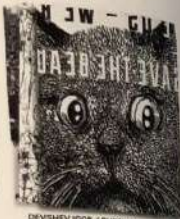
DEVSHEV IGOR / RUSSIA ДЕВШЕВ ІГОР / РОСІЯ