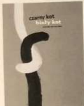
KIRKA TOMASZ / POLAND КІРКА ТОМАШ / ПОЛЬЩА