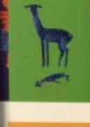
BARBERIS ANDRE / BRAZIL БАРБЕРІС АНДРЕ / БРАЗИЛ