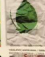
BARBERIS ANDRE / BRAZIL БАРБЕРІС АНДРЕ / БРАЗИЛ