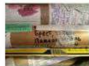
ПОДПИСЬ О ТОМ, ЧТО ПРОИСХОДИТ НА ФОТОГРАФИИ И Т.Д. НА ДРУХЪ ВЪЛКАХ