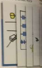
POLAND / POLAND POLAND / POLAND