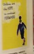
MEXICO / MEXICO MEXICO / MEXICO