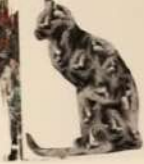
LIU WEIWEI / CHINA ЛІУ ВЕЙВЕЙ / КИТАЙ