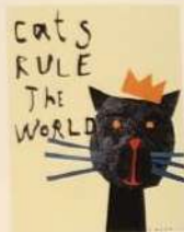
MALTZEVA OLGA / UKRAINE МАЛТЗЕВА ОЛЬГА / УКРАЇНА