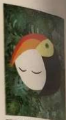
RUSSIA / RUSSIA RUSSIA / RUSSIA