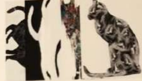
LIU WEIWEI / CHINA ЛІУ ВЕЙВЕЙ / КИТАЙ