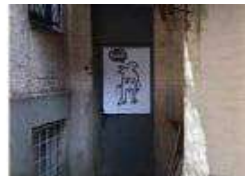
ПОДПИСЬ О ТОМ, ЧТО ПРОИСХОДИТ НА ФОТОГРАФИИ И Т.Д. НА ДРУХЪ ВЪЛКАХ