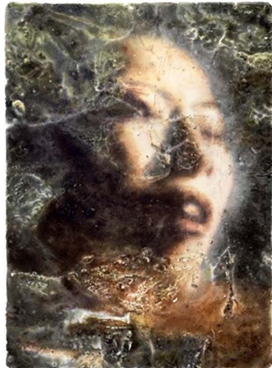
Іл. 9. Ши Чон. Вода, повітря, тіло № 9 . 2014. Папір, акварель. 40 × 29 см. Приватна колекція

Тематично Ши Чон заглиблюється в жіночність і взаємодію між людиною і природою. Майстерне володіння технікою акварелі – «мокрим по мокрому» та «сухим пензлем» – надає його картинам світлової якості: коли світло фільтрується крізь напівпрозорі шари, створюючи відчуття глибини та руху, плинності часу.