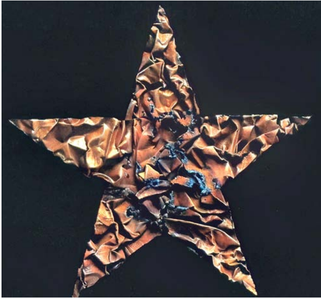
Іл. 3. Лен Цзюнь. Пентаграма 2. 1999. Полотно, олія. 50 × 50 см. Приватна колекція