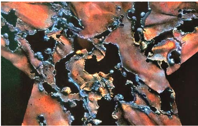
Іл. 4. Лен Цзюнь. Пентаграма 2. Фрагмент

звичаїв у Китаї. Цей підхід є характерною рисою нового реалізму, в якому художники зображають звичайних людей у «постановочних» та символічних композиціях.