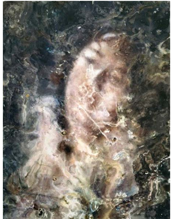
Іл. 8. Ши Чон. Вода, повітря, тіло № 8 . 2014. Папір, акварель. 40 × 31 см. Приватна колекція

стю в китайському суспільстві. Ця техніка дозволяє Ши Чону передати плинність часу та ефемерність людського досвіду. Приглушена палітра та розмиті форми додають твору ефірно-меланхолійної тональності, що підсилює емоційну напругу. Картини стають візуальним коментарем до стану сучасного Китаю, де стрімкі зміни ландшафту та способу життя супроводжуються тугою за втраченим.