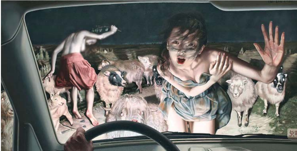
Лл. 6. Лю І. Опівнічна поїздка. 2010. Полотно, олія. 70 × 136 см. Приватна колекція

де глядач стає водієм-спостерігачем. Холодна гама сірих, блакитних і приглушених брунатних тонів домінує, формуючи похмуру атмосферу, яка лише натяками розрізається червонувато-коричневими акцентами другорядної жіночої фігури та отари овець.