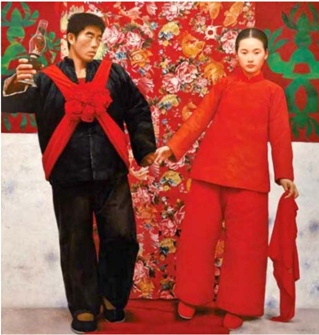
Лл. 1. Ван Ідун. Наречена в горах . 1995–1996. Полотно, олія. 190 × 180 см. Приватна колекція