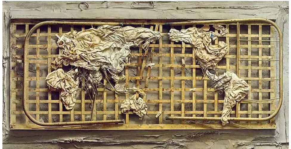
Іл. 5. Лен Цзюнь. Пейзаж століття. 1995. Полотно, олія. 105 × 200 см. Приватна колекція

травми китайського народу та його здатності відроджуватися. Художня цінність серії «Пентаграма» полягає в тому, що вона поєднує фізичну матеріальність із метафізичним змістом. Лен Цзюнь не просто малює метал – він оживляє його як свідка епохи, перетворюючи тліття на магію історичного міфу.