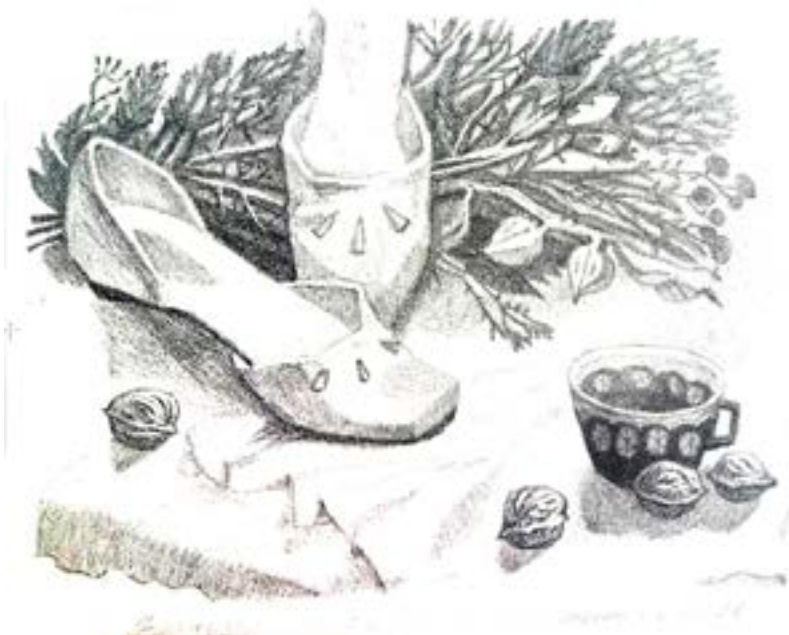
Кобяковська С Натюрморт, літографія 2016