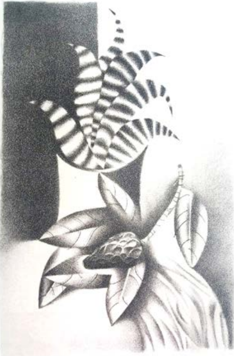
Гайдамака В. Натюрморт, літографія ?