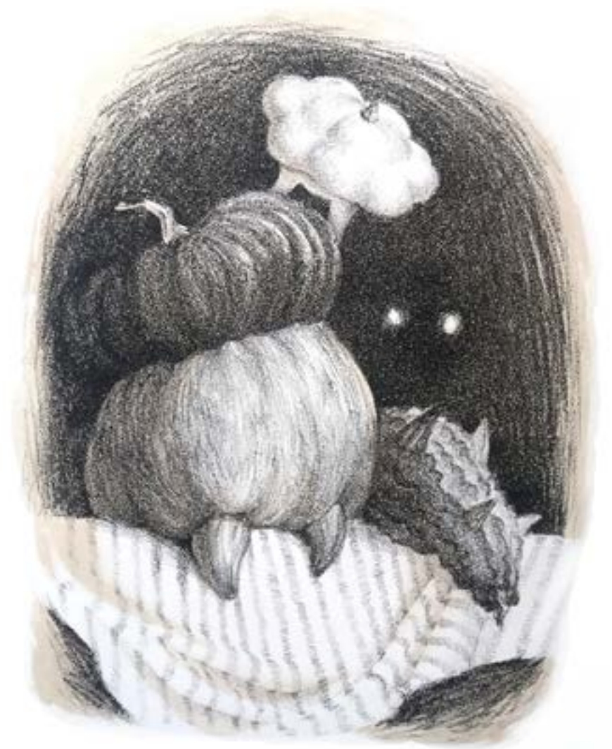
Христенко М. Натюрморт, літографія 2021