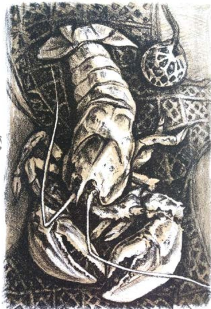
Шаповлов Р. Натюрморт, літографія у два кольори (чорний та сірий) 2015