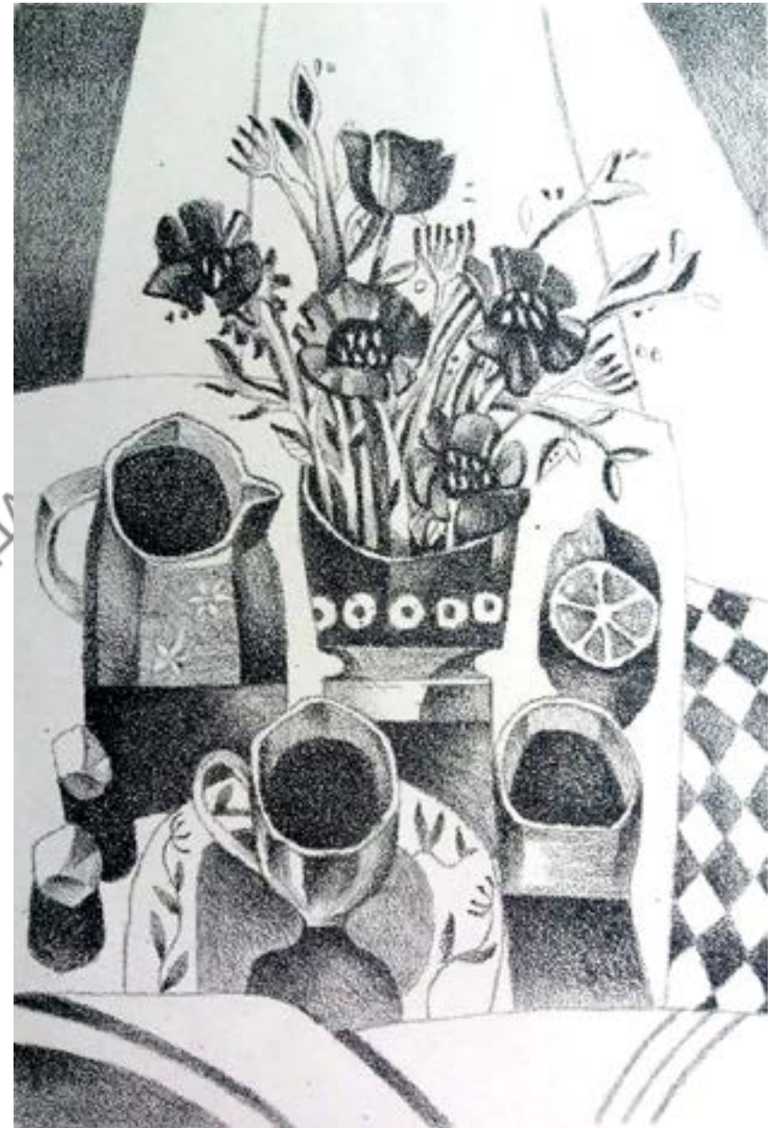
Автор невідомий. Натюрморт, літографія 2017