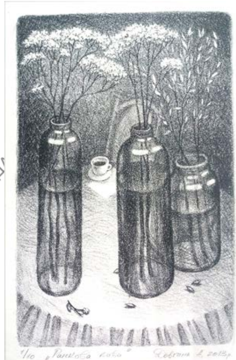
Довгань А. Натюрморт, літографія 2013