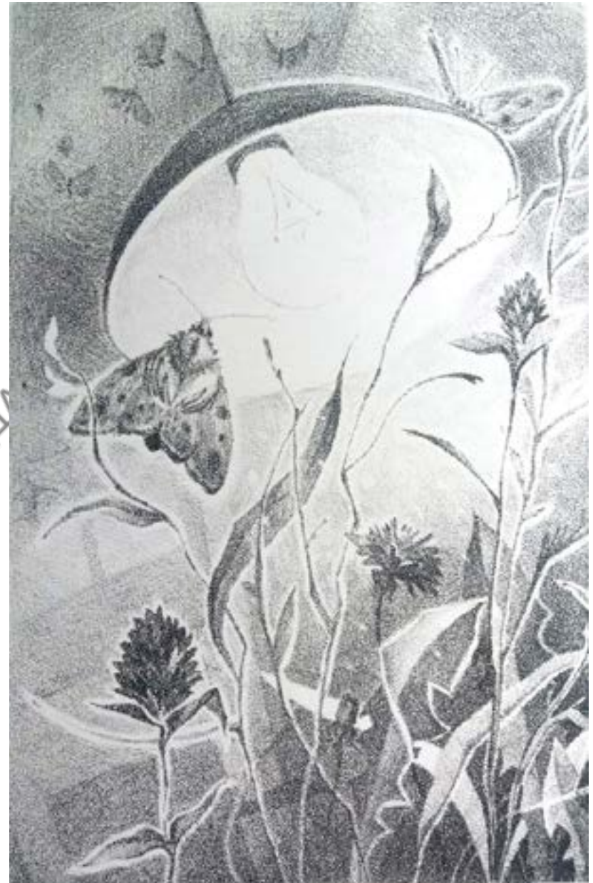
Ясеновська Х. Натюрморт, літографія 2017