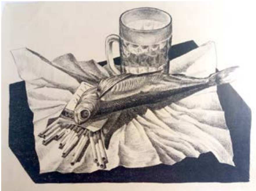
Мисник В. Натюрморт, літографія 2003