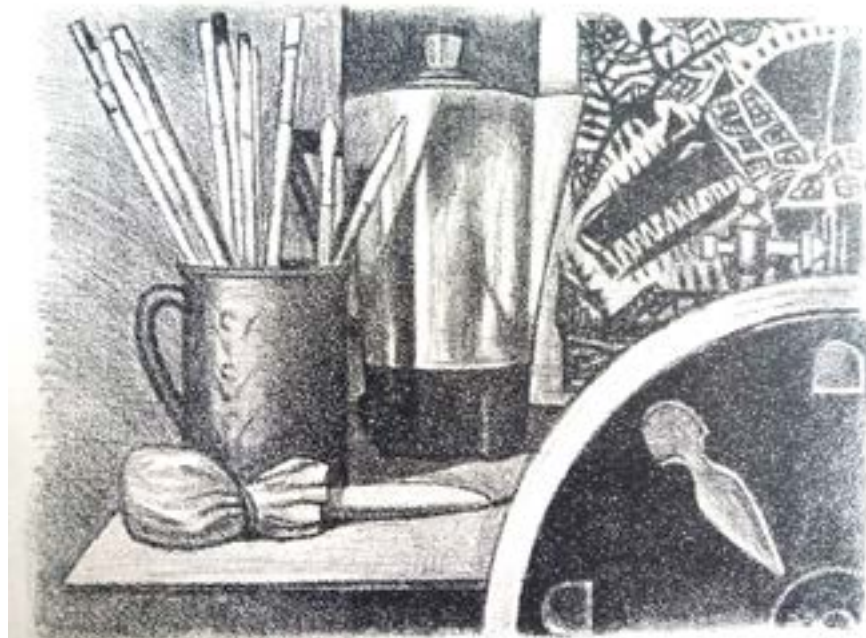
Соколенко А. Натюрморт, літографія ?