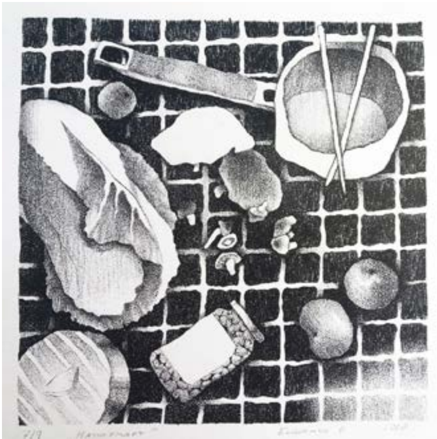
Бишенко А. Натюрморт, літографія 2018