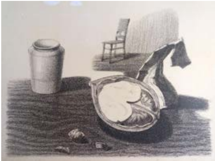
Лепейко А. Натюрморт, літографія 2007