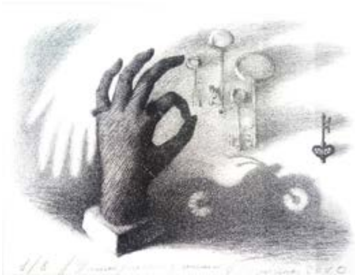
Резніченко О. Натюрморт, літографія 2010