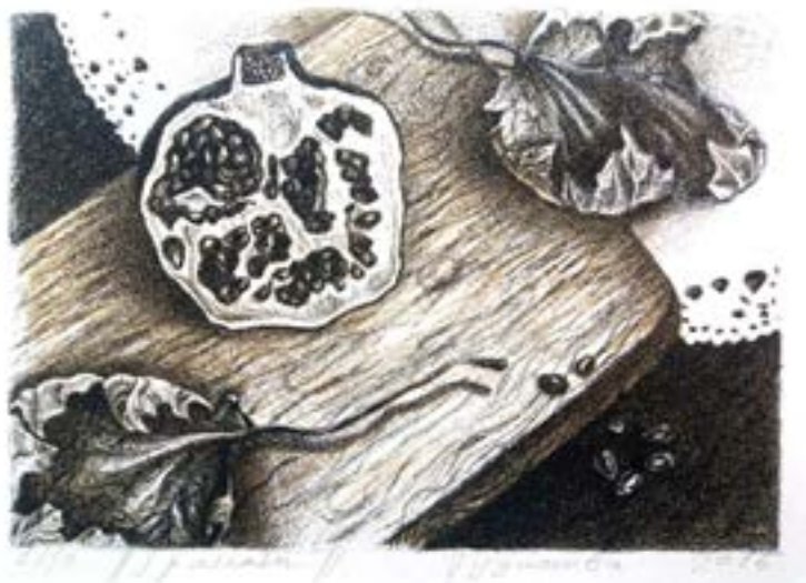
Гудимова А. Натюрморт, літографія у два кольори (чорний та сірий) 2015