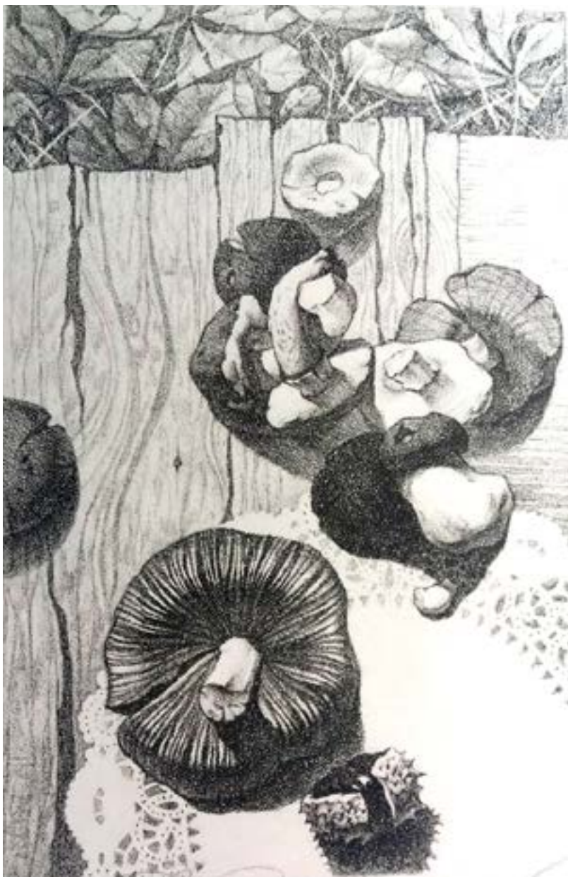
Шульц С. Натюрморт, літографія 2013