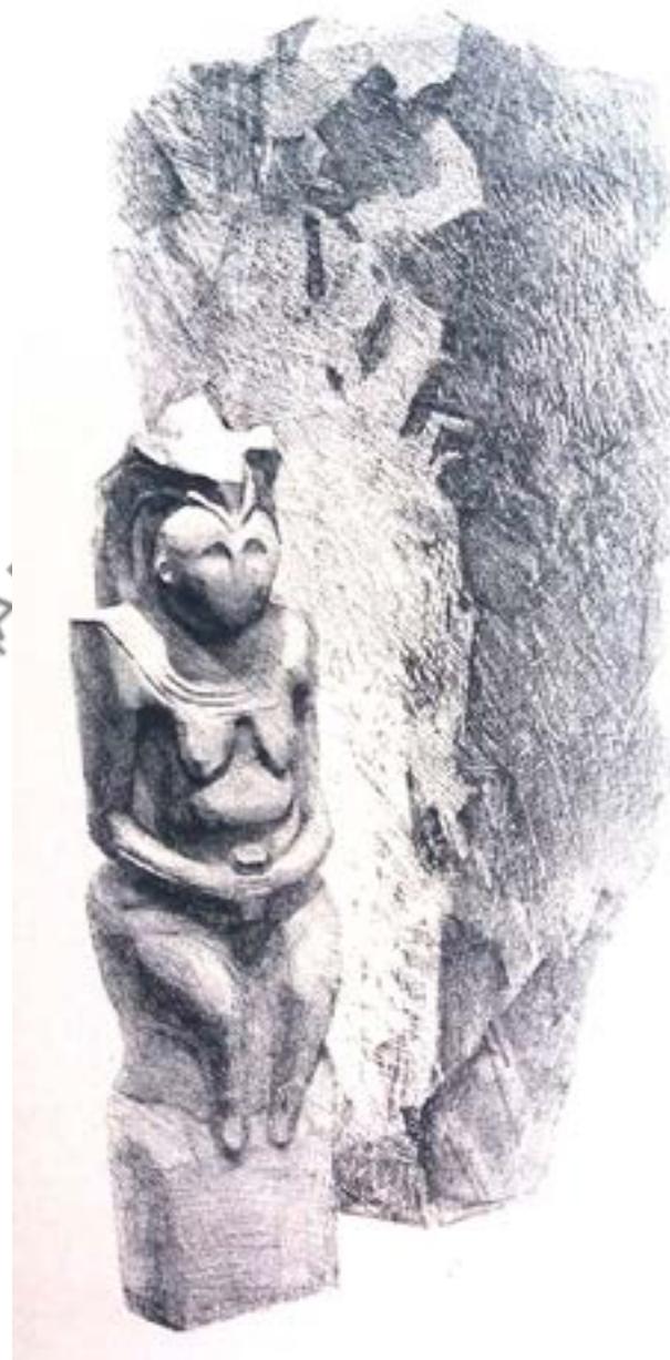
Автор невідомий Натюрморт, літографія ?